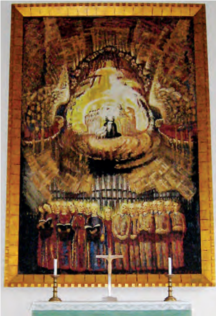
Den jordiska och himmelska lovsången, altartavla i Långsjö kyrka, oljemålning.