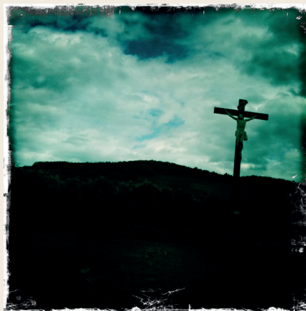
I oroliga tider är den ekumeniska rörelsen en styrka och möjlighet att arbeta för fred.

Under det ekumeniska året uppmärksammas även att det är 1 700 år sedan det första ekumeniska kyrko-